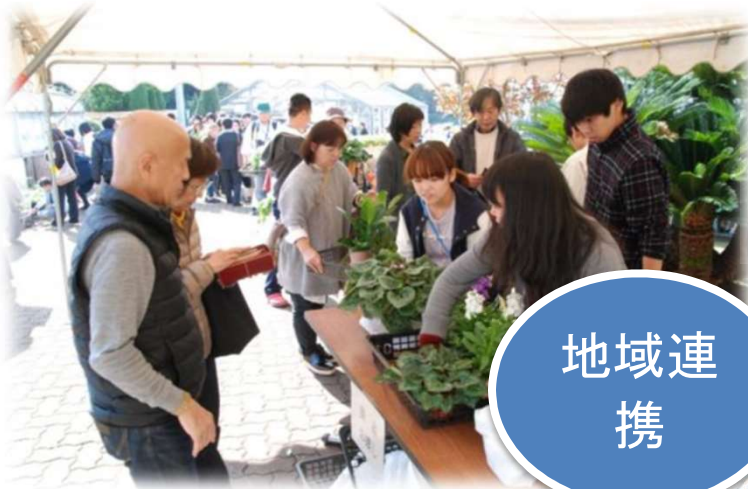
園芸展での生産品販売